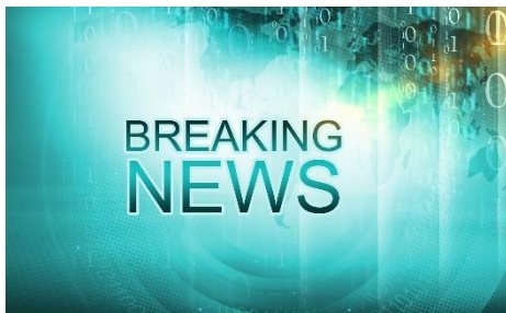
説明・アナウンスのプロ