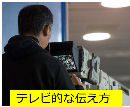
テレビ的な伝え方